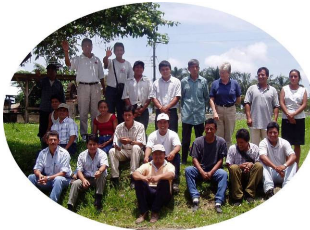
Hauptverantwortliche (Organisation) des Projekts

Heute leben ca. 1000 Menschen von diesem Projekt, das immer mehr zum Modellprojekt wird.