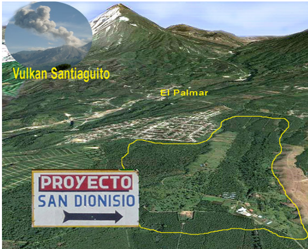
San Dionisio aus dem All betrachtet

Mit vielen Spenden aus Teugn und aus den Landkreisen Kelheim und Regensburg, dem Institut St. Bonifatius, Schulen und Einrichtungen, mit dem Erlös von Aktionen und Publikationen konnte 1994 der Kauf einer Kaffeeplantage für verarmte Familien ermöglicht werden. Unterstützung kam immer wieder durch die Medien, Presse, Rundfunk und Regionalfernsehen.